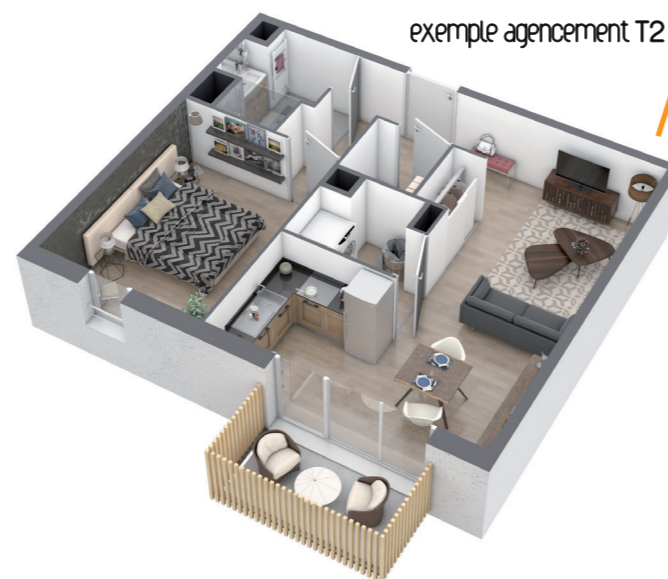
exemple agencement T2