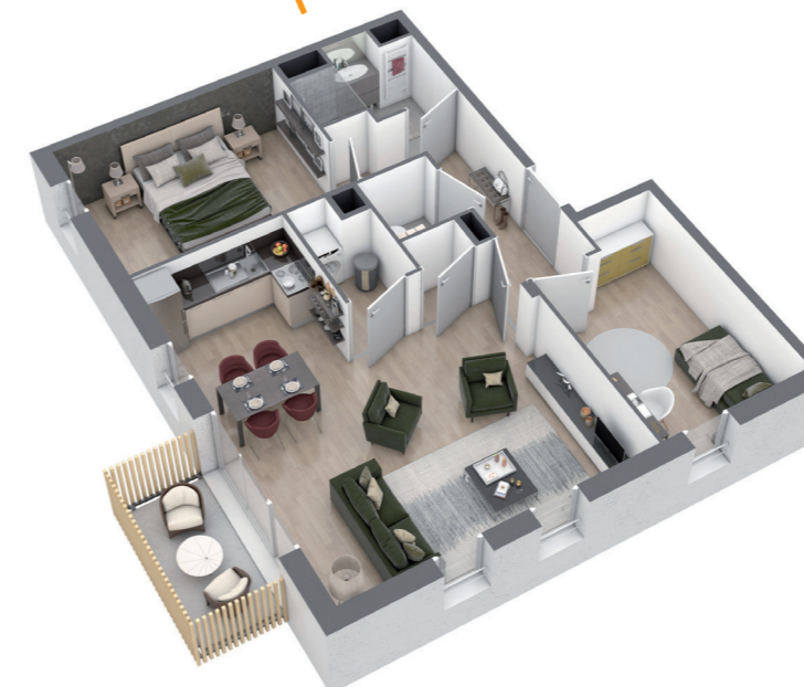
exemple agencement T3

T2 ≈ 50 m 2 compris entre 300 et 340 € / mois (2)